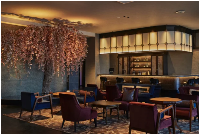
光に照らされた櫻が7色に移ろう「月下の櫻Lounge & Bar」