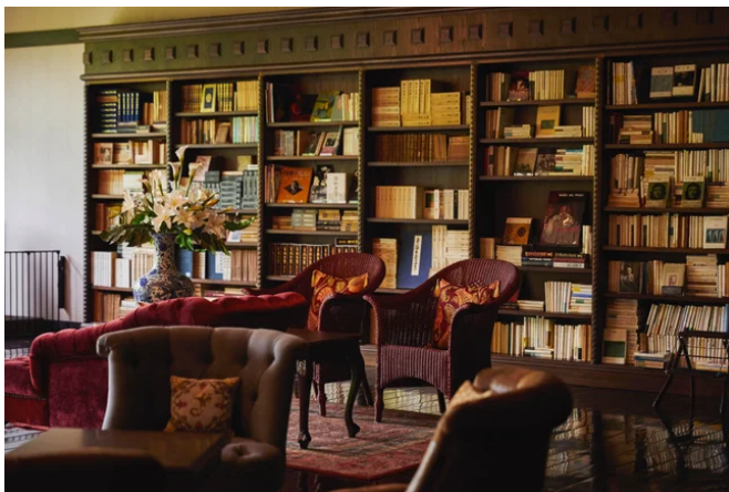
3万冊の蔵書を誇る「みすずLounge & Bar」