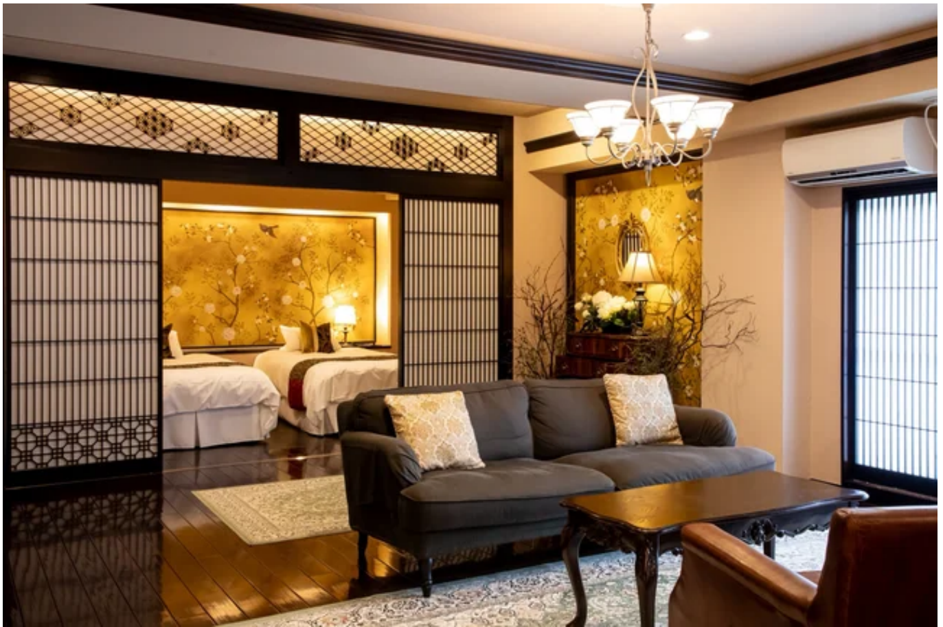
全部屋で「Valpas」を導入した「蓼科 親湯温泉」の客室イメージ