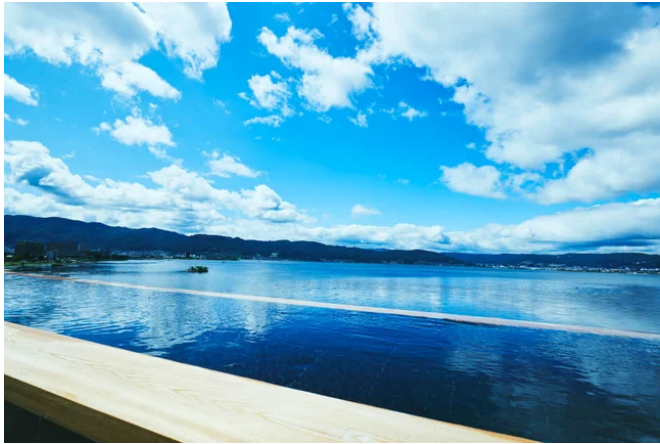
諏訪湖のインフィニティな景色広がる展望露天風呂 「綿雲」